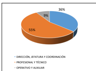
GRÁFICO Nº 1 ESTRATO DEL CARGO